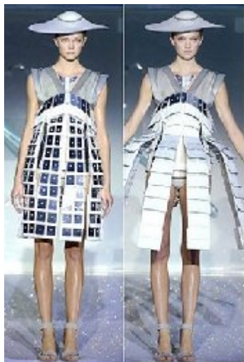
Хуссейн Чалаян. «Живые» платья