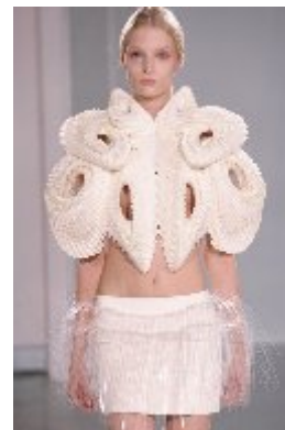
Ирис Ван Херпен. Платье из коллекции «Весна-лето». 2012 г.

Достижения в области высоких технологий, всеобщая компьютеризация производства позволяет дизайнерам воплощать свои идеи, применяя недоступные ранее материалы в своей коллекции, воссоздавая объемную фактуру, чтобы удовлетворить тактильные потребности потребителя.