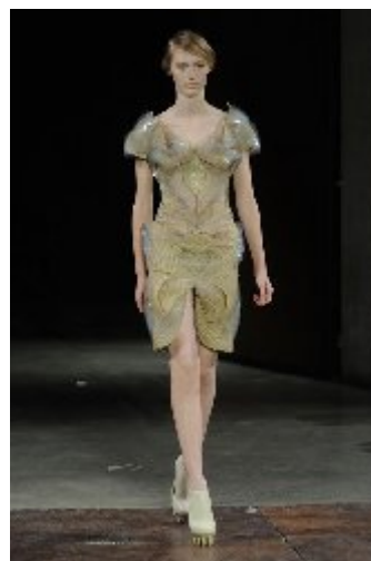
Ирис Ван Херпен. Платье из коллекции «Весна-2012»

3. Перенос нетрадиционных пластических свойств материала на объект. Впервые изменение состояния и свойств предмета начали использовать в сюрреализме, «уничтожая» структурные особенности предмета, превращая состояние твердого в текучее, жидкого – в твердое. Постепенно этот прием начали заимствовать другие направления искусства и в том числе арт-дизайн. Один из самых ярких представителей арт-дизайна Гаэтано Пеше (Gaetano Poesce), бунтарь эпохи 1960-х. Итальянский архитектор и дизайнер мебели, чье творчество отличается смелыми технологическими экспериментами и своей особой эмоцией. Он впервые изготовил