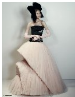
Виктор & Ролф. Платье из коллекции 2010 г.

Нелинейный принцип формообразования дизайнерам интересен тем, что он расширяет границы сознания в создании новых форм, пропорций, конструкции, разрушая стереотипы и привлекая новых клиентов, готовых к эксперименту.