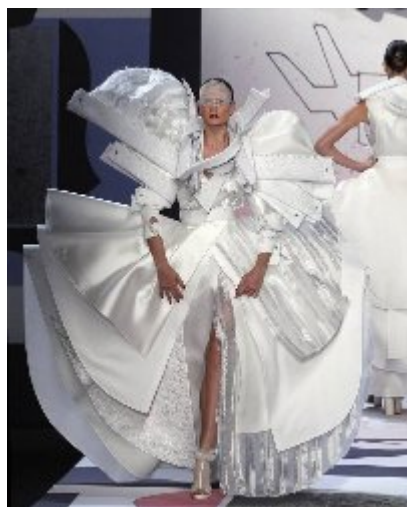
Виктор & Ролф. Платье из коллекции «Весна-лето». 2011 г.

Photoshop, после чего архитектор создал на их основе 3D-модели, а мастер отлил «в полимере».