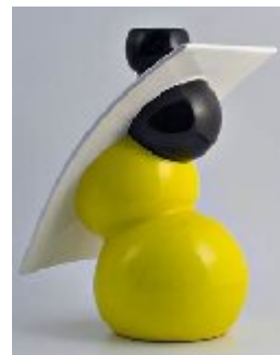
А. Мендини. «ABC collection»

В промышленном дизайне принцип нелинейности реализован, например, в работе А. Мендини (Alessandro Mendini) под названием «ABC collection». Среди дизайнеров одежды можно назвать дуэт голландских дизайнеров Виктор & Ролф (Viktor & Rolf), женская коллекция 2010 года которых была основана на нелинейности и иллюзии трехмерности за счет геометрических форм моделей. Исси Мияке (Issey Miyake), один из самых изобретательных японских дизайнеров-художников создает одежду и арт-композиции [6. С. 53], вдохновившись древним искусством оригами. Он запустил новую концептуальную линию под названием 132 5, модели которой были созданы традиционным способом складывания фигур в данном случае – из плоского куска ткани.