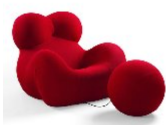
Гаэтано Пеше. Кресло. Serie Up 2000

серию мебели из нетрадиционного материала – полиуретана без жесткой конструкции, под названием «Up».