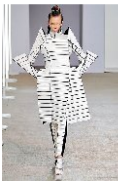
Гарет Пью. Платье из коллекции «Осень-зима». 2007 г.

При использовании этого приема в дизайне одежды дизайнеры применяют, либо имитируют, такие материалы, как пластик, металл, дерево. Например, в коллекции «Осень-зима» 2007 года английский дизайнер Гарет Пью (Gareth Pugh) создал модели оригинальной формы и фактуры из прямоугольных пластиковых пластин. Дизайнер Ирис Ван Херпен (Iris Van Herpen) в моделях коллекции 2012 года реализовала образ космической и, в то же время женственной леди, выполнив платье из пластика, резины и других технологичных материалов. В своей коллекции британский дизайнер Кристофер Кейн (Christopher Kane) декорировал модели вставками из окрашенной жидкости, запаянной в резину.